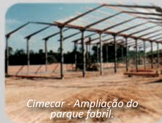
Cimecar - Ampliação do parque fabril.