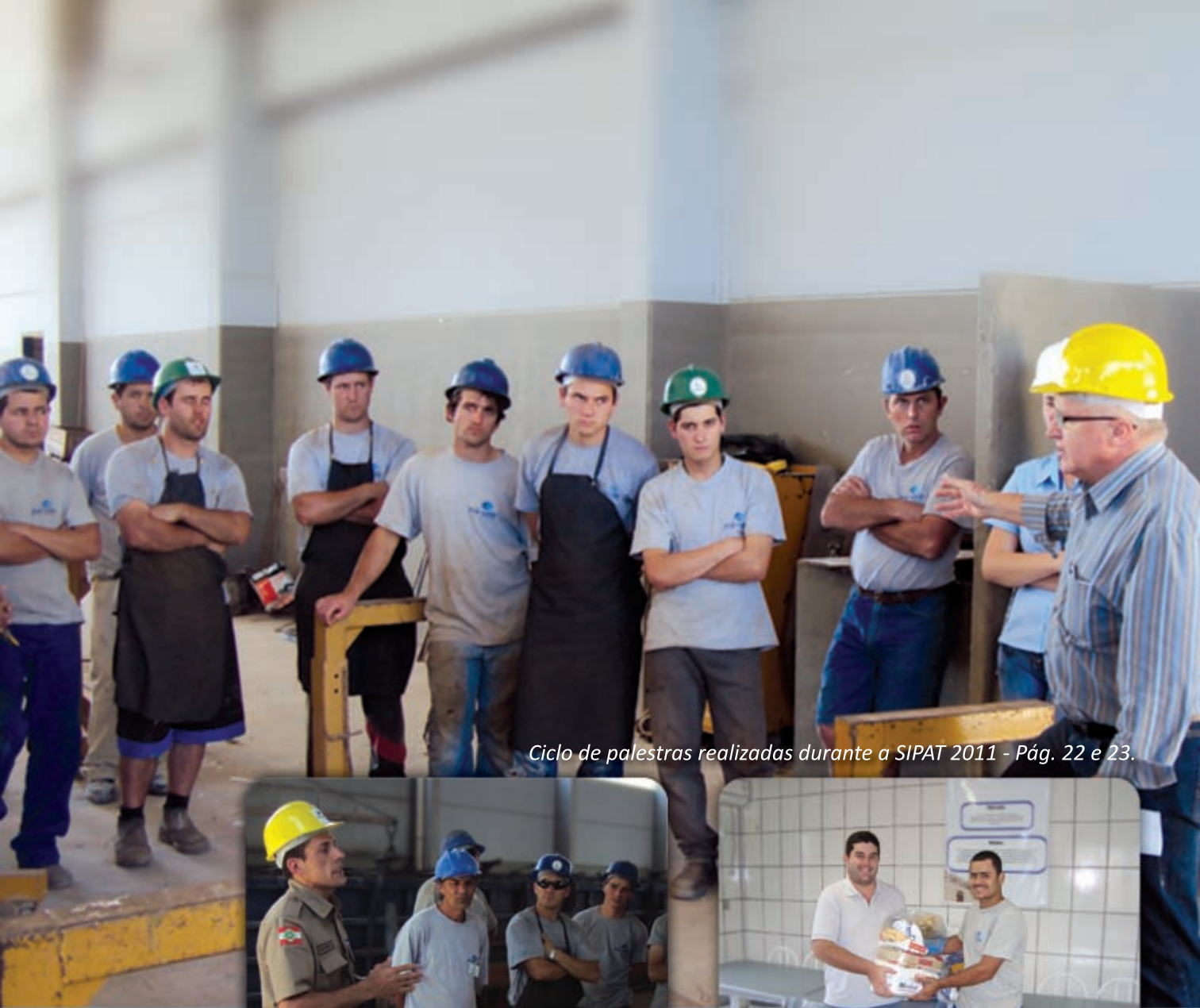
Ciclo de palestras realizadas durante a SIPAT 2011 - Pág. 22 e 23.