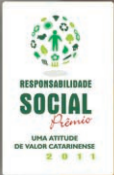
Troféu de Responsabilidade Social - Destaque SC.