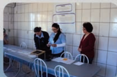
Divulgação, votação e apuração de votos do Programa Funcionário Cidadão.