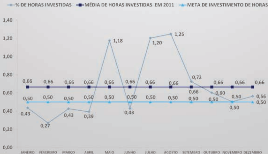
Porcentagem de Horas de Treinamentos 2011

Anualmente a Pré-va também viabiliza a ida de colaboradores à feiras do segmento e investe em capacitação técnica, como é o caso do curso em Segurança do Trabalho.