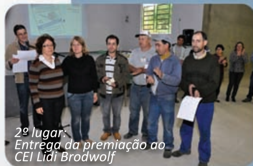
2º lugar: Entrega da premiação ao CEI Lidi BrodWolf