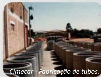
Cimecar - Fabricação de tubos.