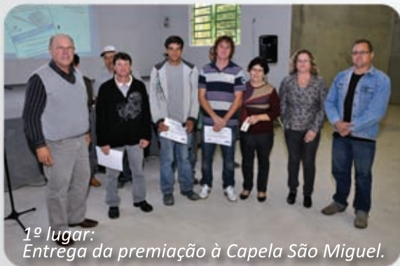
1º lugar: Entrega da premiação à Capela São Miguel.