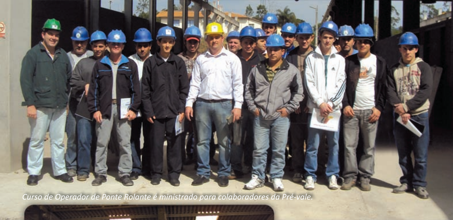
Curso de Operador de Ponte Rolante é ministrado para colaboradores da Pré-vale.