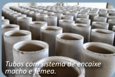
Tubos com sistema de encaixe macho e fêmea.