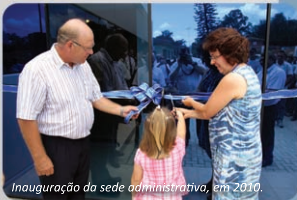
Inauguração da sede administrativa, em 2010.

A Pré-vale investe constantemente em tecnologias que garantem a qualidade de seus produtos e prima pela valorização do seu quadro funcional.