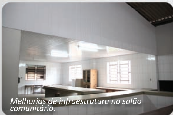
Melhorias de infraestrutura no salão comunitário.

Os dirigentes da Capela propuseram o revestimento cerâmico e a forração de PVC da cozinha. Com a execução do projeto, as instalações ficaram muito mais bonitas, além de atenderem os padrões exigidos pela vigilância sanitária. Segundo os dirigentes, a reforma deve beneficiar mais de mil pessoas da comunidade.