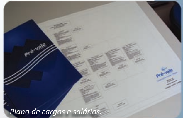
Plano de cargos e salários.

A empresa disponibiliza aos colaboradores o Plano de cargos e salários, deixando transparentes as regras de ascensão e a política de salários. Assim, cada colaborador que ingressa na Pré-vale conhece quais são suas possibilidades na empresa.