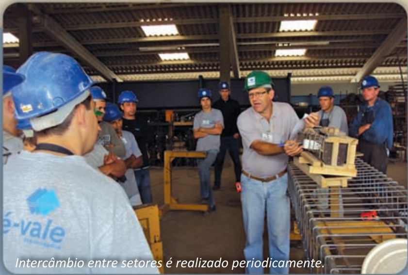
Intercâmbio entre setores é realizado periodicamente.