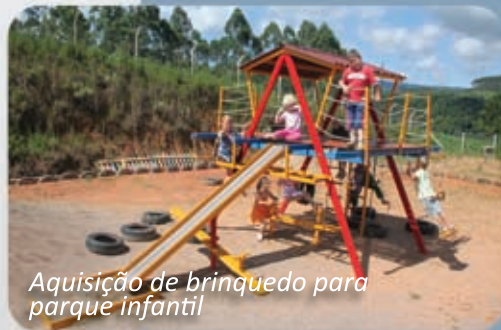
Aquisição de brinquedo para parque infantil