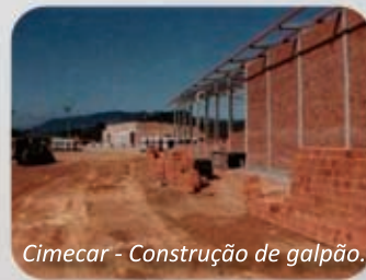
Cimecar - Construção de galpão.