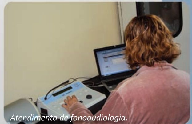
Atendimento de fonoaudiologia.

A empresa oferece seguro de vida, médico do trabalho, atendimento de fonoaudiologia e grandes facilidades na realização de exames laboratoriais.