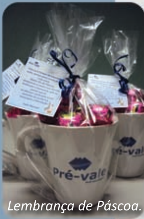
Lembrança de Páscoa.

A Páscoa e o Natal também são datas que não passam despercebidas na Pré-vale. Presentes e sacolas natalinas foram entregues nessas datas. É a forma que a Pré-vale encontra de se fazer presente na confraternização familiar de seus colaboradores.