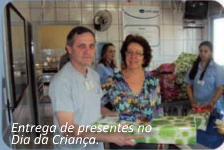
Entrega de presentes no Dia da Criança.

A Pré-vale realiza ações e eventos que envolvem e valorizam os colaboradores e suas famílias. Em 2011 a Pré-vale presenteou os filhos dos colaboradores com até 12 anos de idade pela passagem do Dia das Crianças. Cento e vinte sete crianças foram presenteadas por intermédio dos pais.