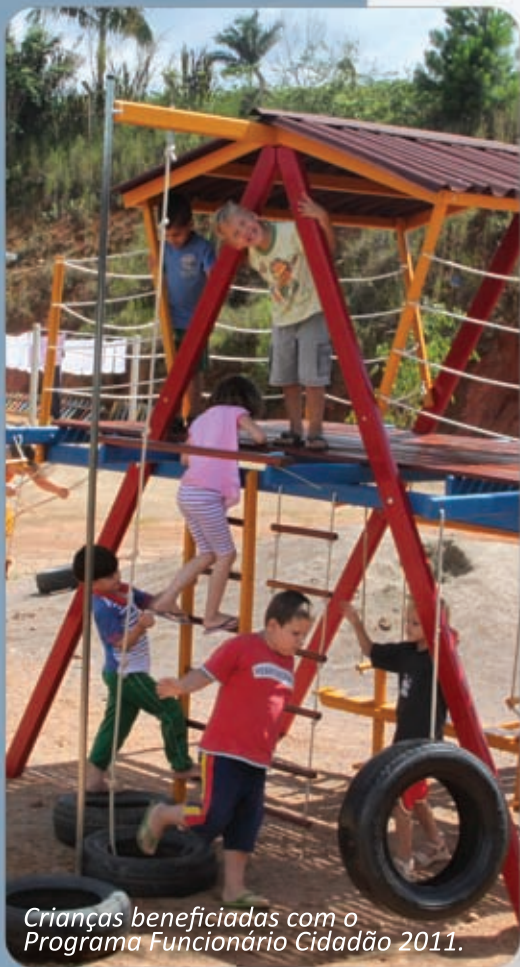
Crianças beneficiadas com o Programa Funcionário Cidadão 2011.

Muito além da filantropia, a Pré-vale buscou ações que além de ceder recursos financeiros, mantivessem um envolvimento com as partes beneficiadas, promovendo uma transformação sociocultural. Por isso, em 2011, a Pré-vale realizou a 2ª edição do Programa Comunitário Funcionário Cidadão.