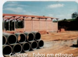
Cimecar - Tubos em estoque.