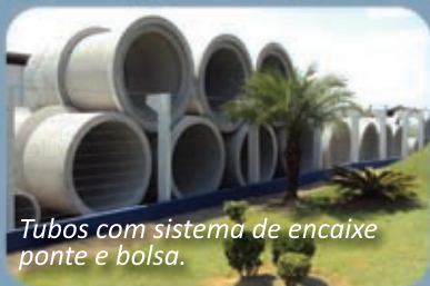
Tubos com sistema de encaixe ponte e bolsa.