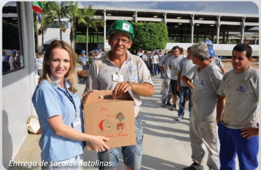
Entrega de sacolas natalinas.