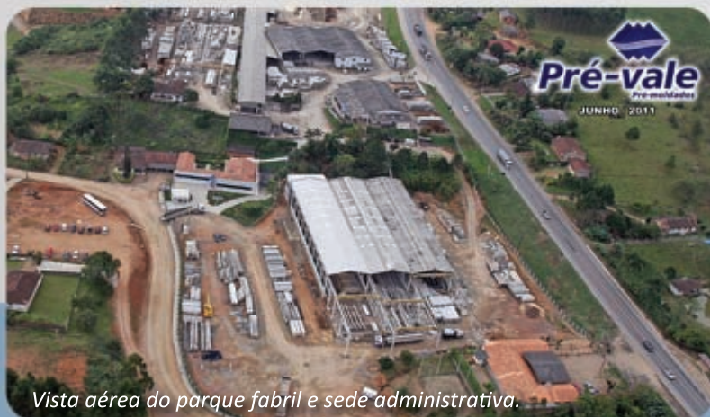
Vista aérea do parque fabril e sede administrativa.

Produtos e serviços de qualidade, profissionais qualificados, comportamento ético e o relacionamento de confiança com colaboradores, fornecedores e clientes proporcionam alto valor agregado a seus negócios.