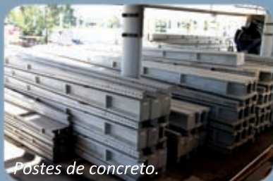
Postes de concreto.

Nossa empresa atende um público diversificado com soluções versáteis, de forma personalizada.