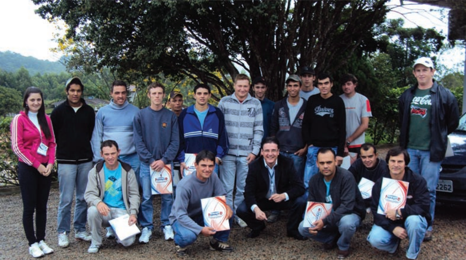
Colaboradores realizam curso de Relações Humanas e Motivação no Contexto Pessoal e Profissional.